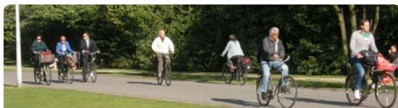
Vanuit de belangrijkste fietsroutes in één beweging de IJfiestunnel in.

Gebruikmaken van bestaande infrastructuur is veel goedkoper en sneller te realiseren dan het bouwen van een nieuwe tunnel, een brug of een kabelbaan. Het is ook droog, comfortabel en bedrijfszeker, wat bij een brug en een kabelbaan nog maar te bezien is. Het is ook geen ongewone oplossing: bijvoorbeeld in de Alpen komen twee rijrichtingen in één buis veel voor. Een alternatieve oplossing is om fietsers de rechtersstrook te geven en de auto's de linker. Uit oogpunt van comfort, gezondheid en veiligheid stellen we voor dat uitsluitend elektrische voertuigen in zo'n oplossing door de IJtunnel mogen rijden.