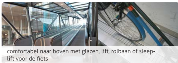
comfortabel naar boven met glazen, lift, rolbaan of sleep-lift voor de fiets