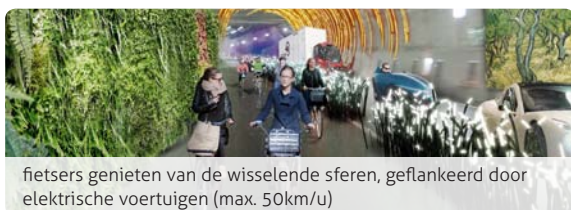
fietsers genieten van de wisselende sferen, geflankeerd door elektrische voertuigen (max. 50km/u)