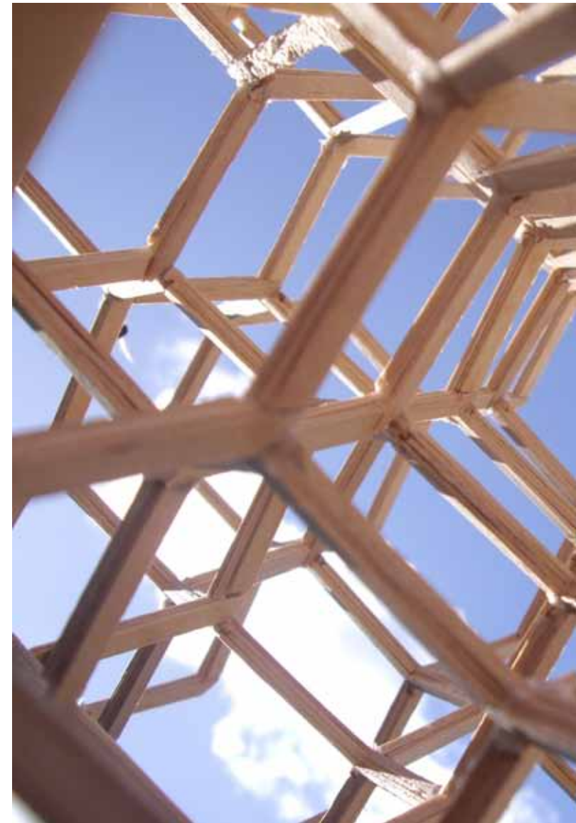
› Lorimerlite Framework

Ook in de communicatie naar externe stakeholders en bezoekers vervullen de parkprincipes een belangrijke rol. Ze inspireren anderen om zelf ook te handelen naar de duurzaamheidsprincipes van het park.