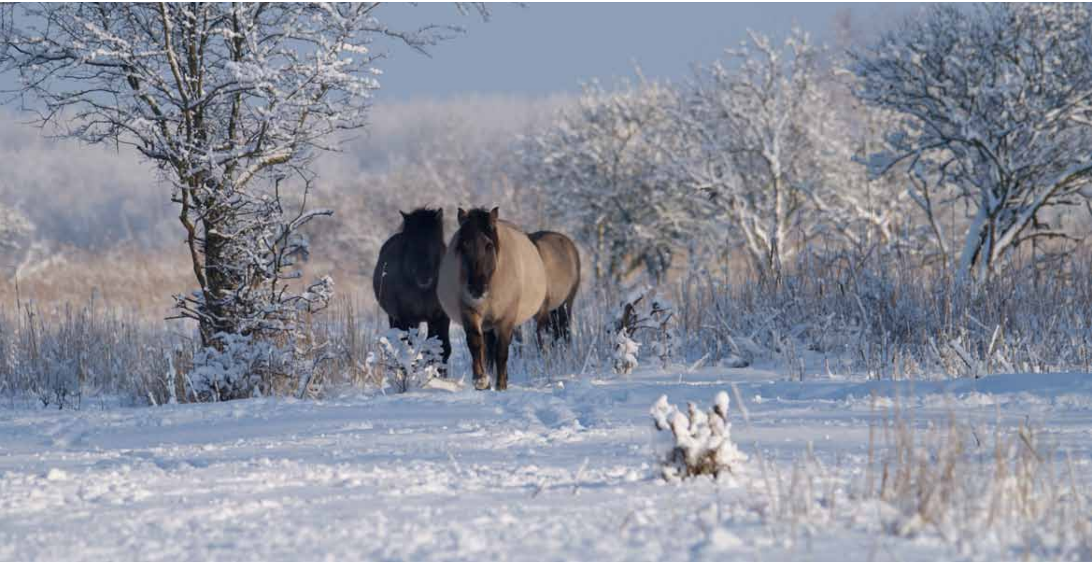
› Wilde Koniksparden Oostvaardersplassen in wintertijd Door Astrid Van Wesenbeeck