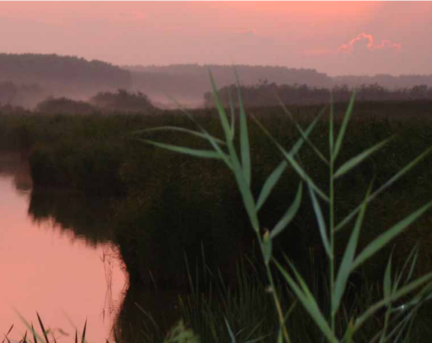
› Oostvaardersplassen Avond Door Eva-Maria Kintzel