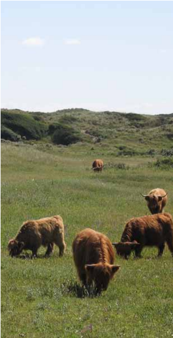
› Grote grazers zorgen voor natuurbeheer